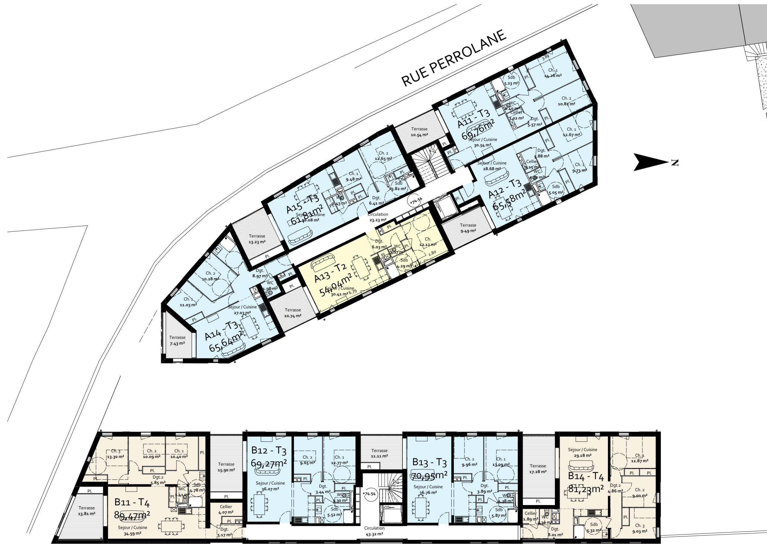
Plan R+1 1 : 200

MAITRE D'OUVRAGE: CITADIS 6, Passage de L'Oratoire - 84000, Avignon Tél: 04 90 27 57 02 - Fax : 04 90 85 90 72