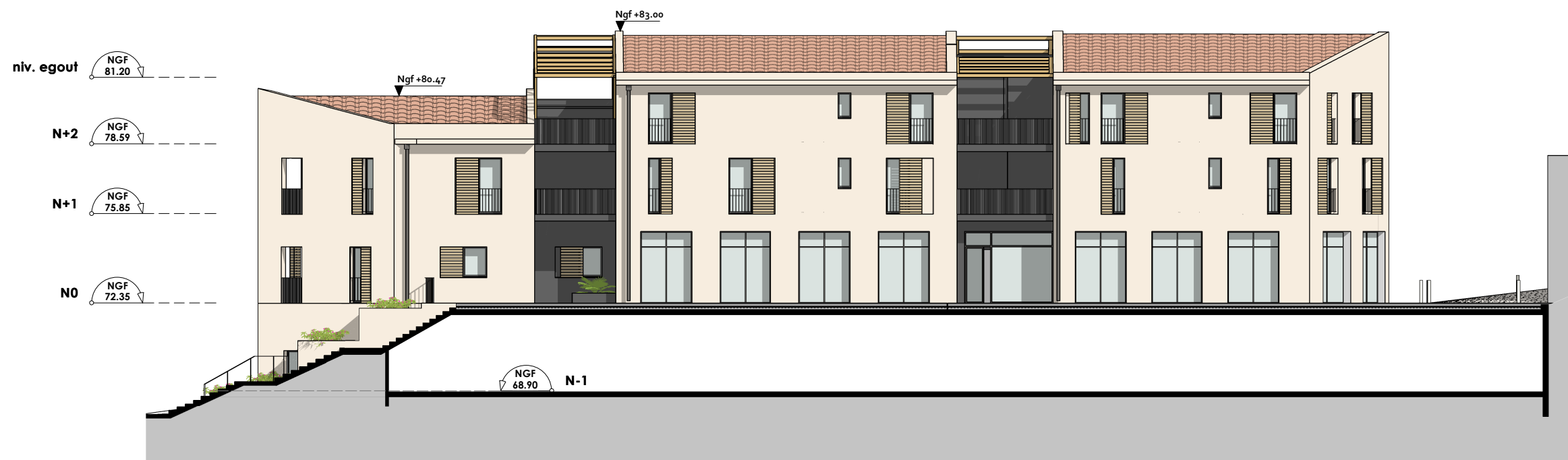
APS Façade Est Bâtiment A