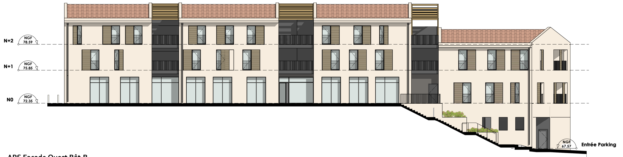
APS Facade Ouest Bât.B