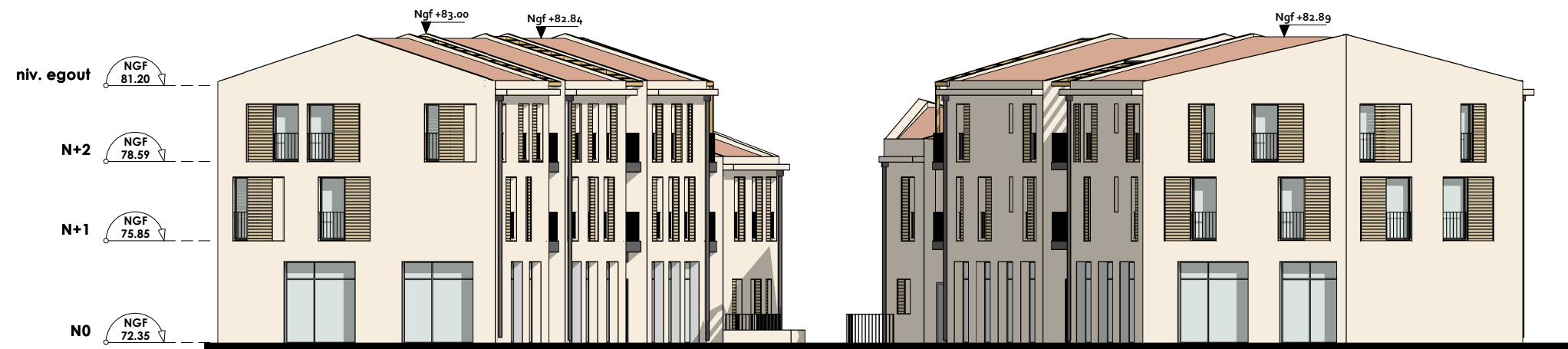
APS Façades Nord