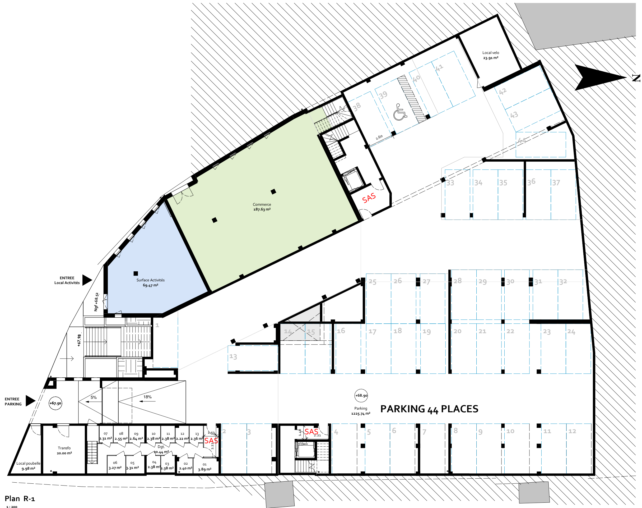
Plan R-1 1 : 200

MAITRE D'OUVRAGE: CITADIS 6, Passage de L'Oratoire - 84000, Avignon Tél: 04 90 27 57 02 - Fax : 04 90 85 90 72