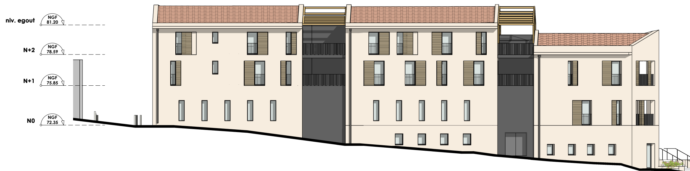
APS Façade Ouest Bâtiment A