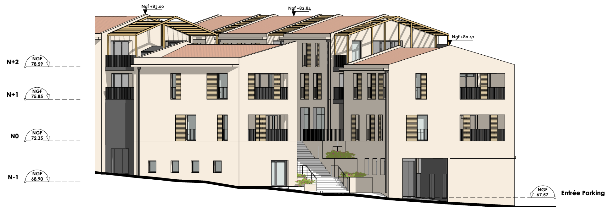
APS Façades Sud